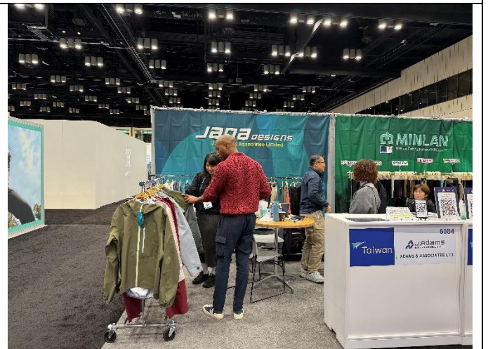
源姓與買主洽談情形