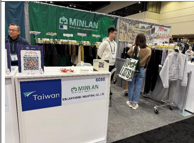
銘朗公司與買主洽談情形