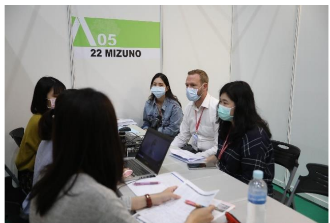
TITAS 2020 採購洽談會