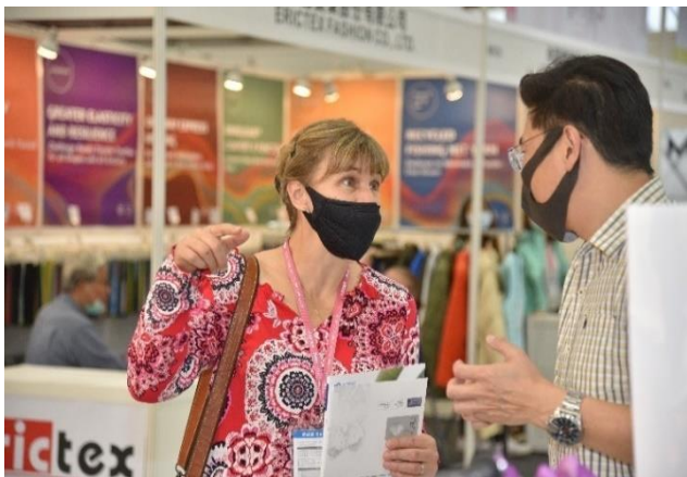
國際買主與 TITAS 2020 展商洽談