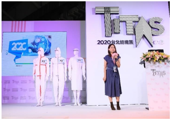
TITAS 2020 醫療防護紡織品發表會