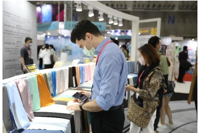
買主參觀 TITAS 2020 形象區