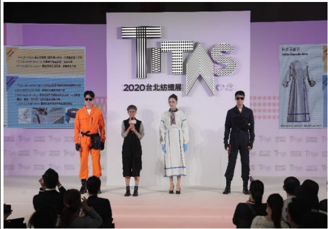
TITAS 2020 高機能紡織品發表會