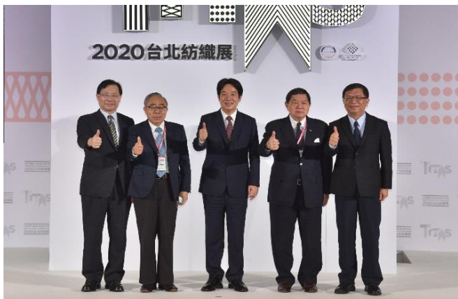
賴副總統蒞臨 TITAS 2020