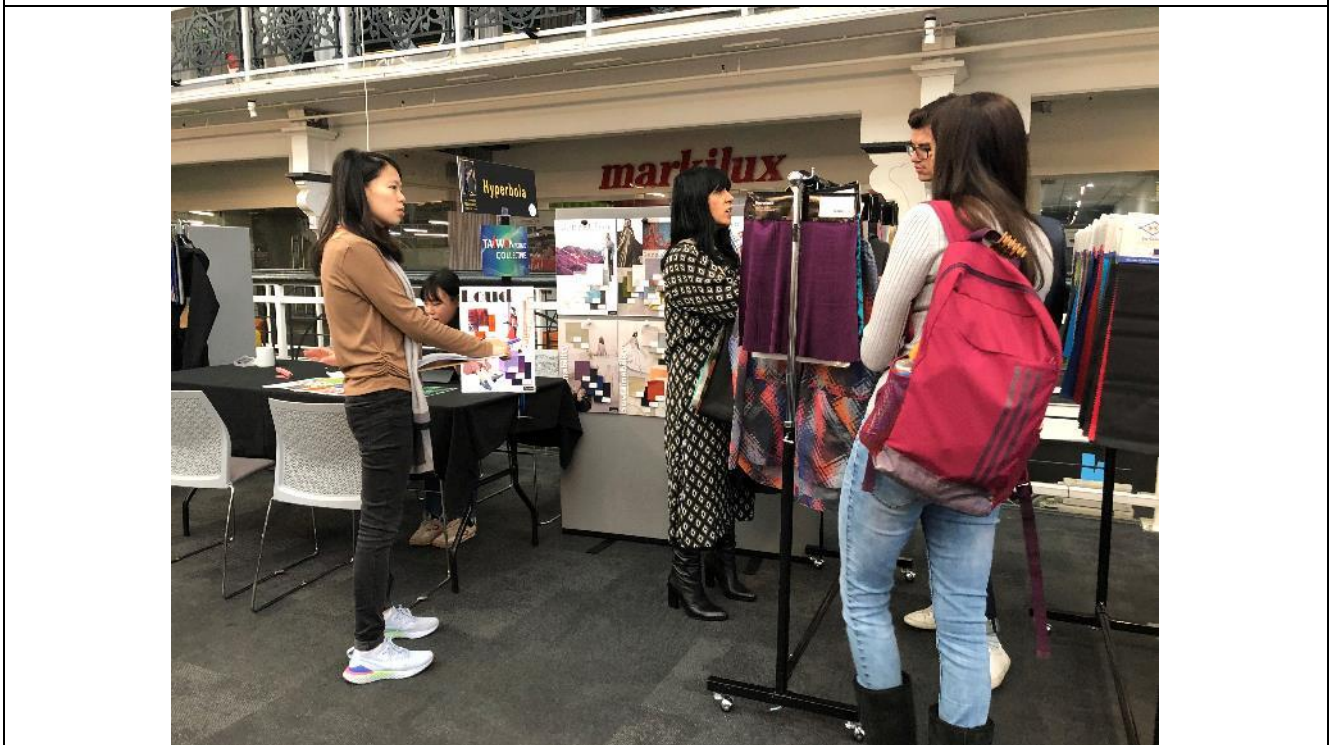
寧美公司與買主洽談情形