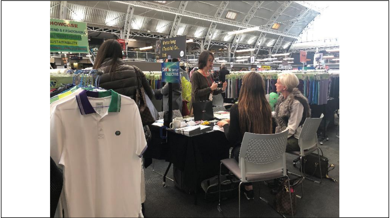
維隆公司與買主洽談情形