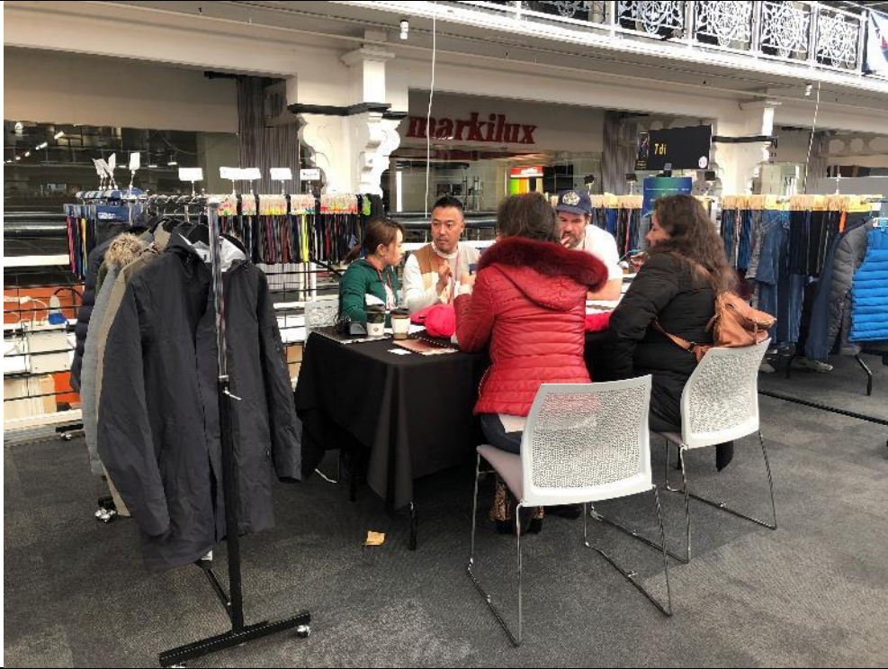
昀冠公司與買主洽談情形