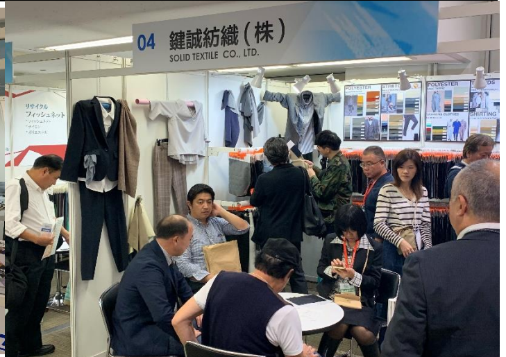
參展廠商與買主洽談熱絡