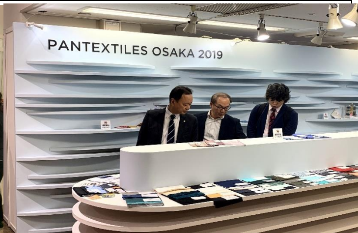
以廠商布料佈置形象區發揮蒐尋指引效果