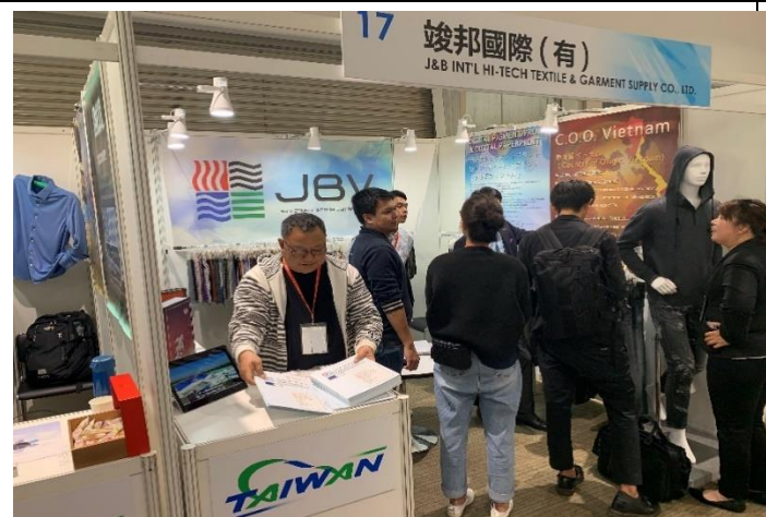
買主到場參觀踴躍