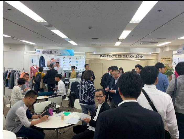
買主換證進場參觀絡繹不絕