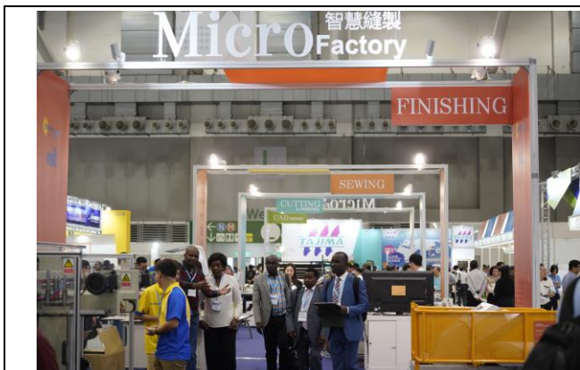
國外買主參觀微型工廠示範專區