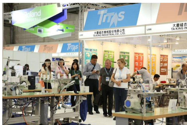
國外買主參觀智慧縫製展區