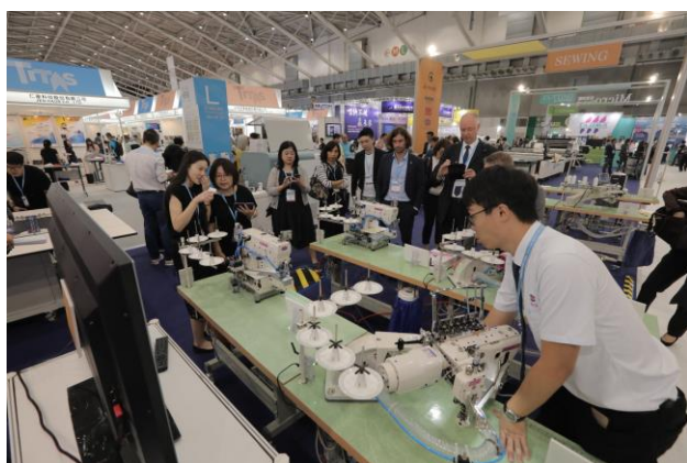
星菱縫機向德國買主就縫紉機應用自動化進行解說