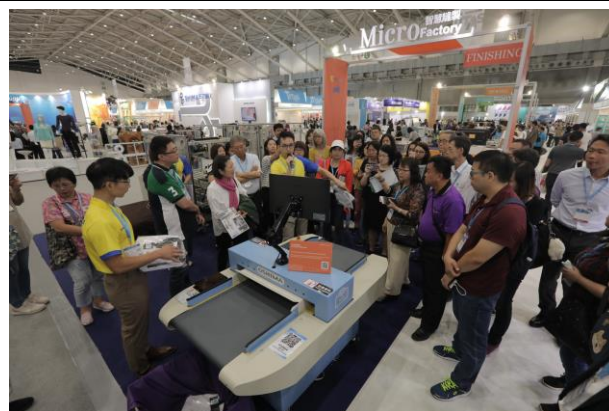
歐西瑪向參觀團買主就縫製設備進行解說