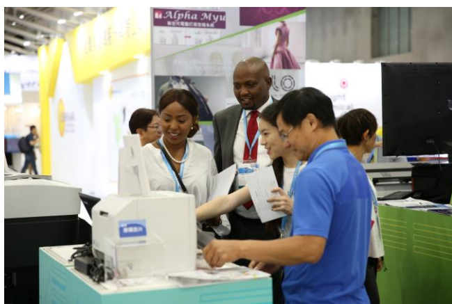
東洋紡向國外買主就電腦打版系統進行解說