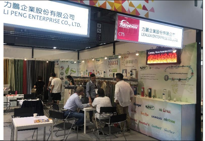
買主於台灣館洽談情況(力鵬公司)