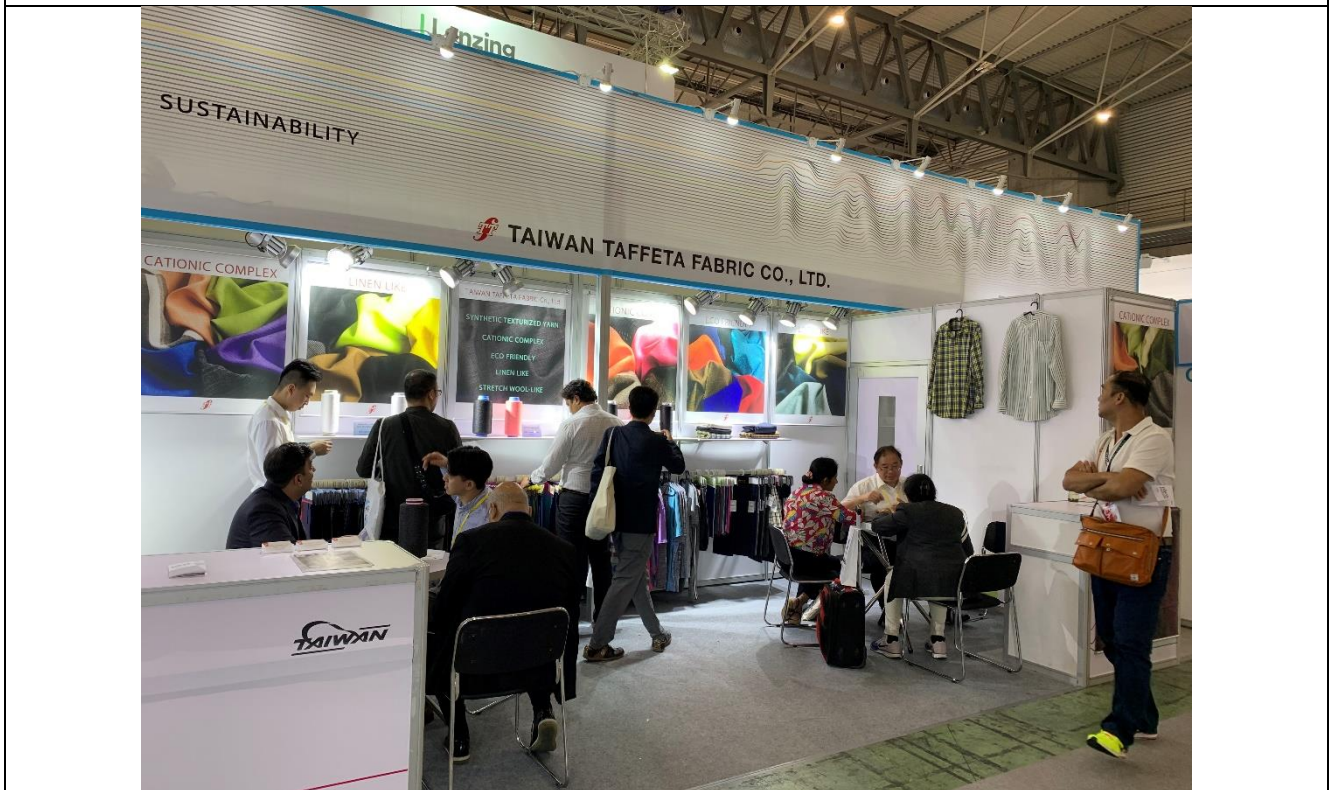
臺灣富綢公司洽談情形