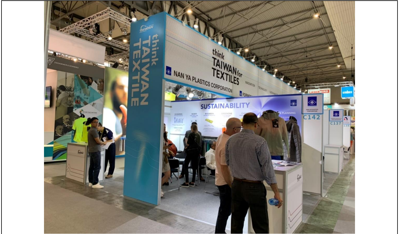
南亞公司攤位洽談情形