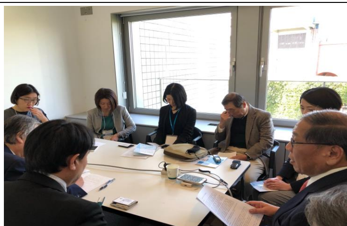
黃秘書長現場與日本紡織產業媒體座談