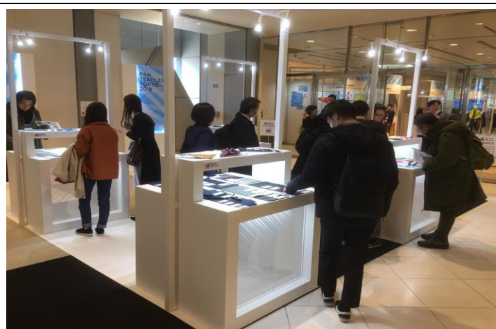
以展商布料佈置形象區發揮蒐尋指引效果