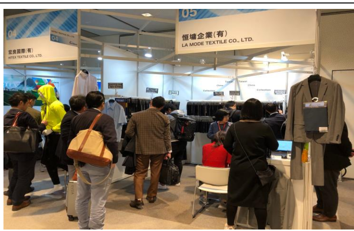
參展商與買主洽談