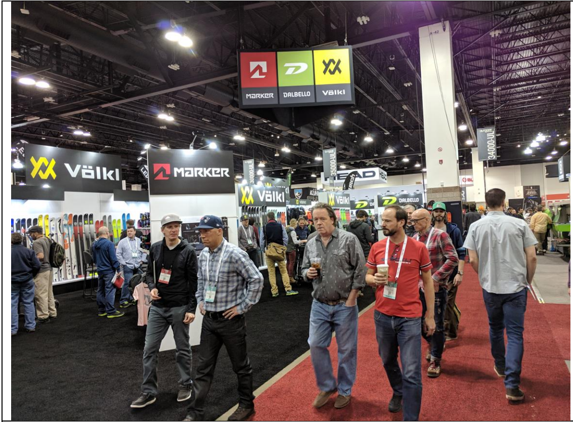
參觀人潮湧現丹佛 The Colorado Convention Center 展覽館