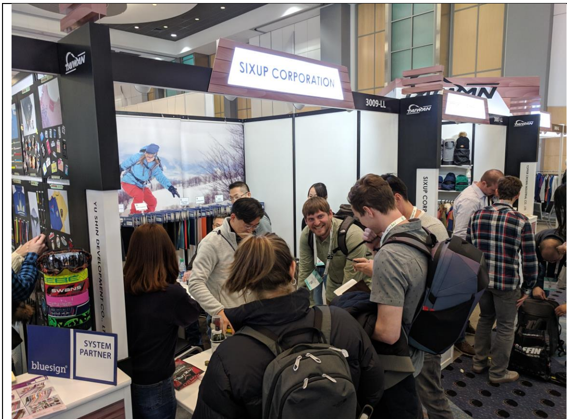
臺灣館廠商攤位洽談情形