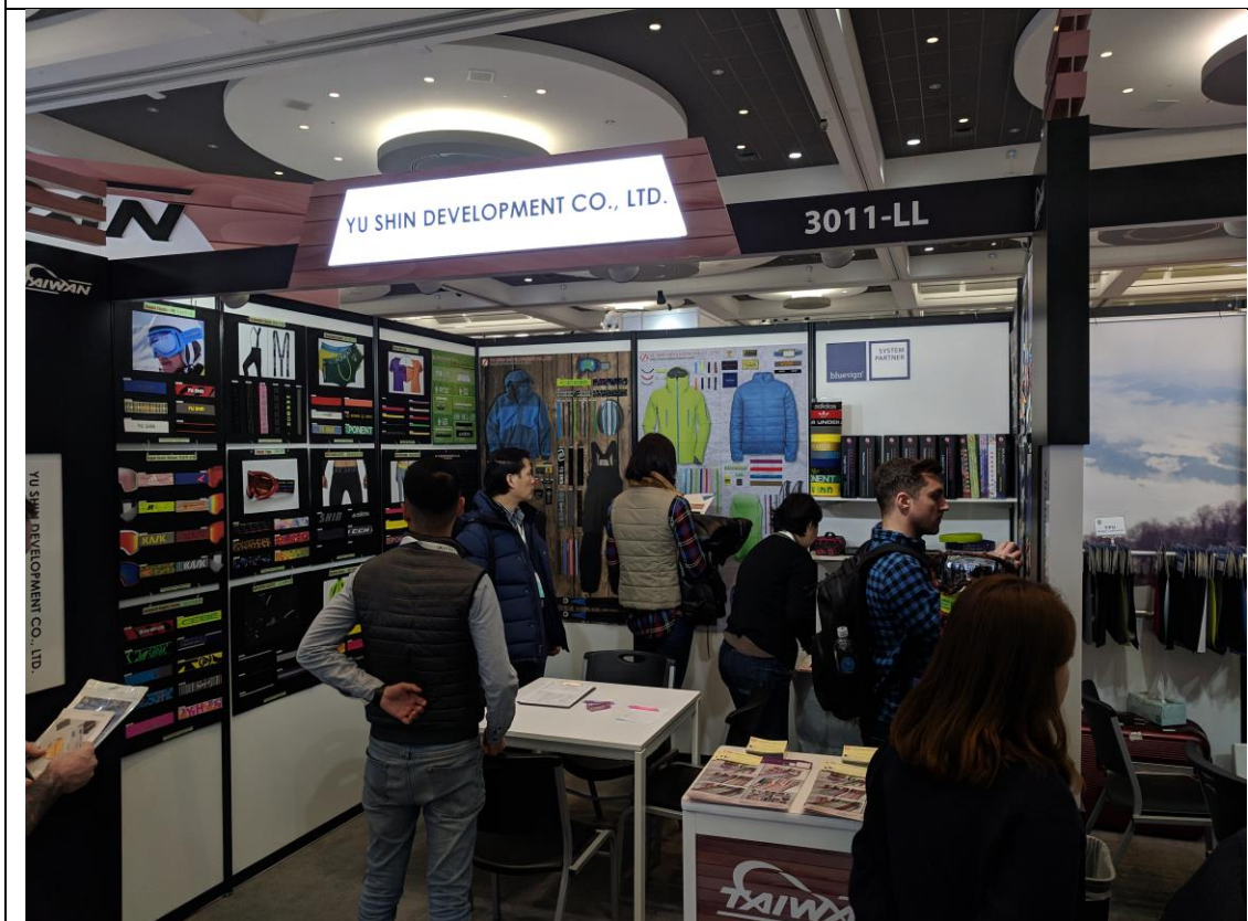
臺灣館廠商攤位洽談情形