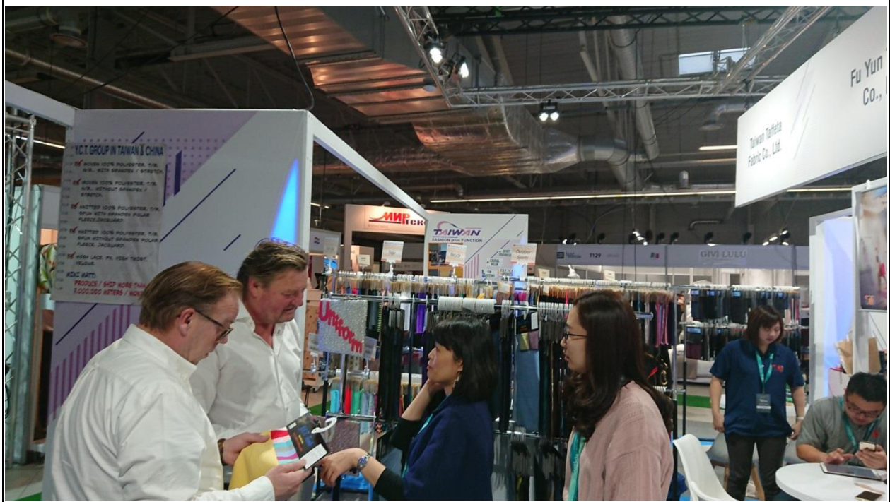
焜樺公司與買主洽談情形