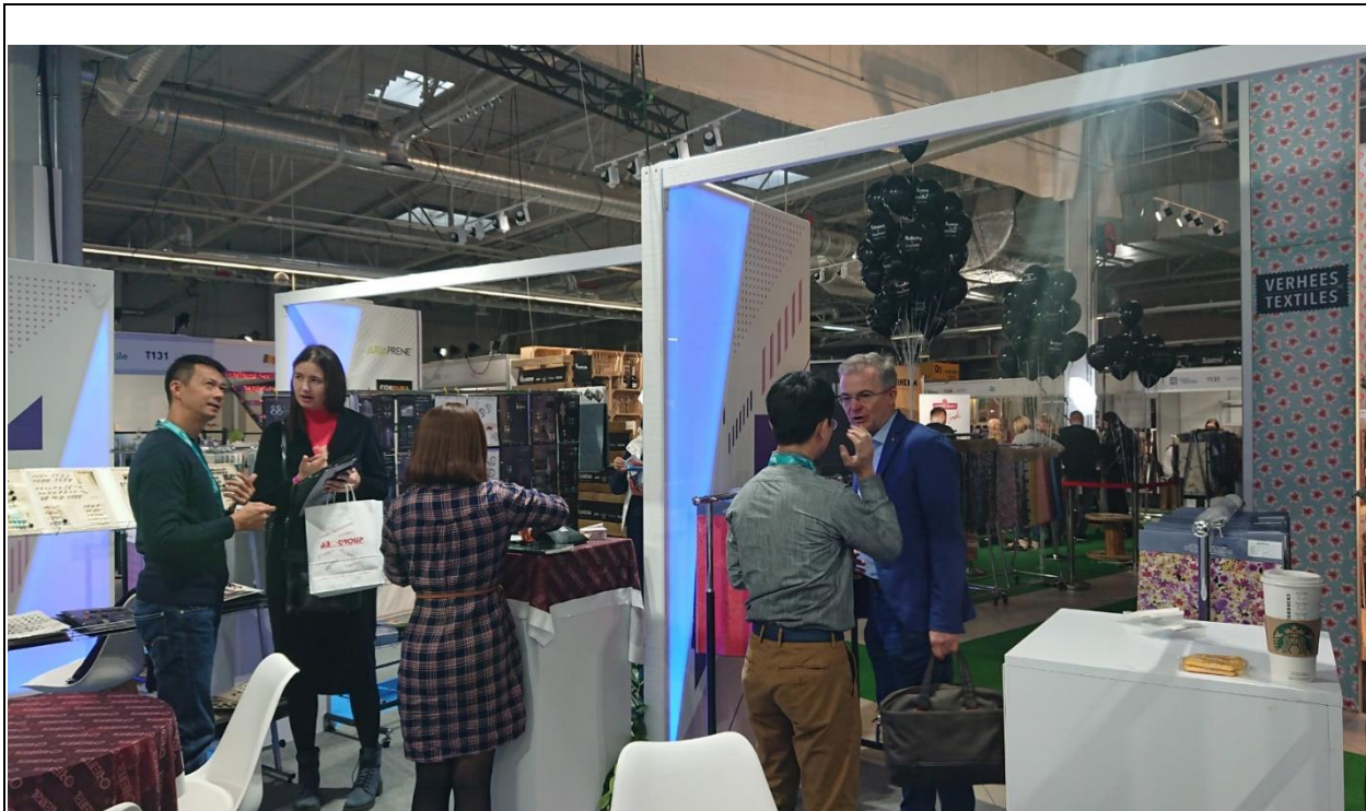
買主蒞臨臺灣館一景