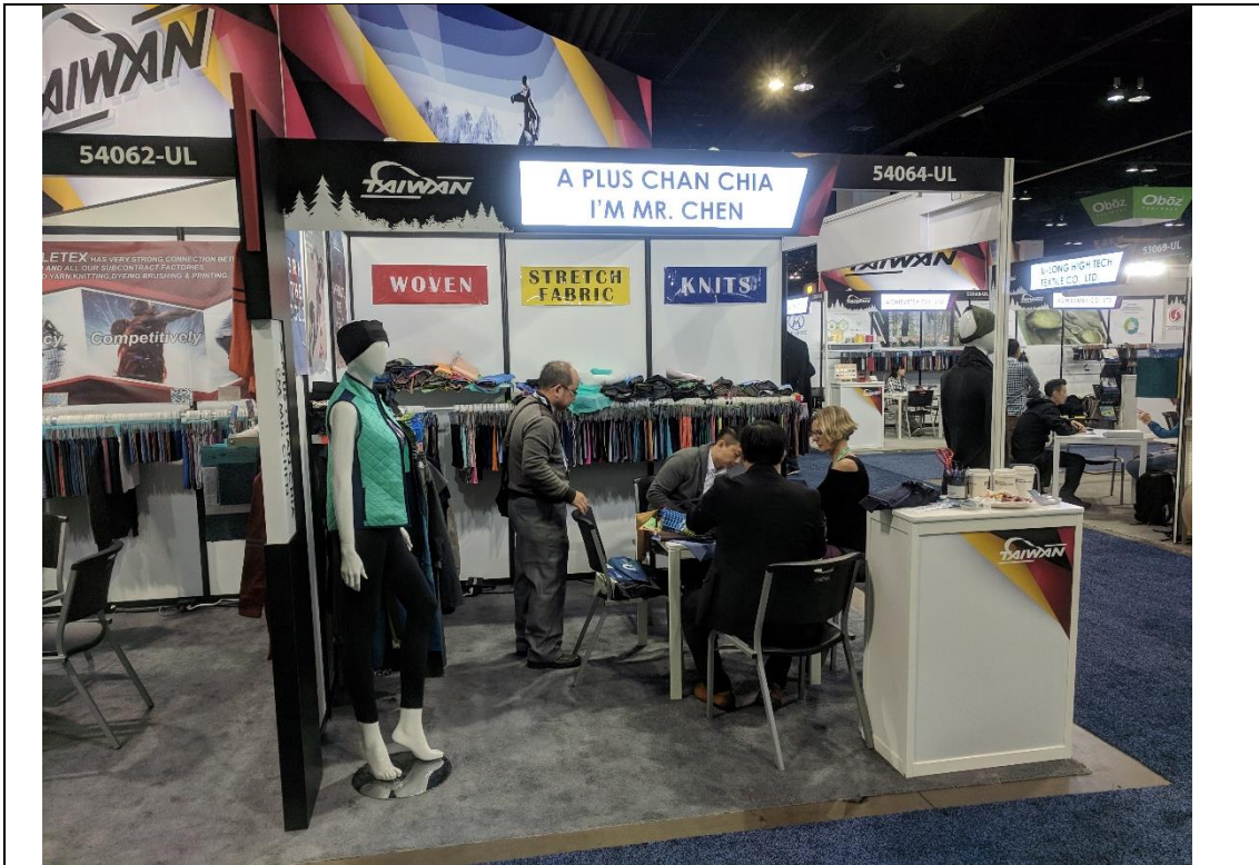
湛珈公司展出情形