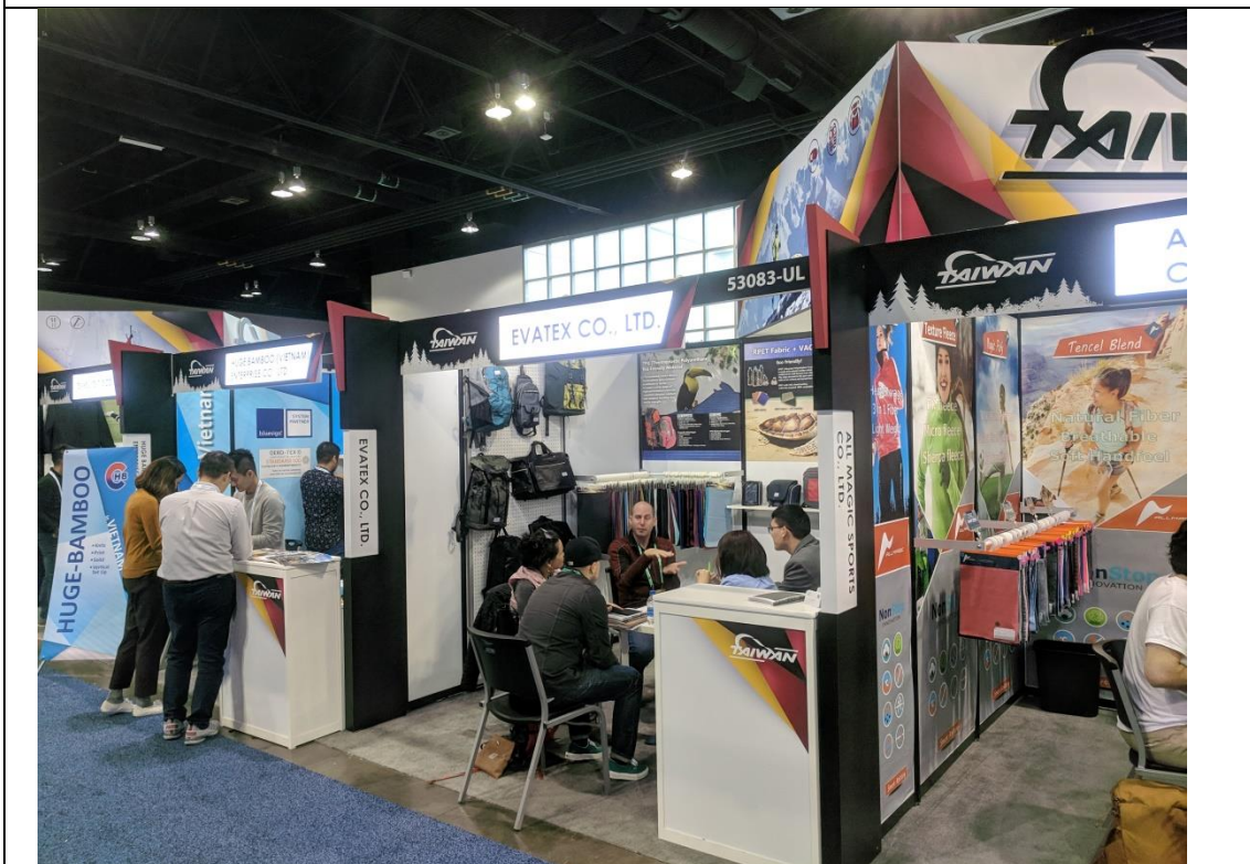
錫安公司展出情形