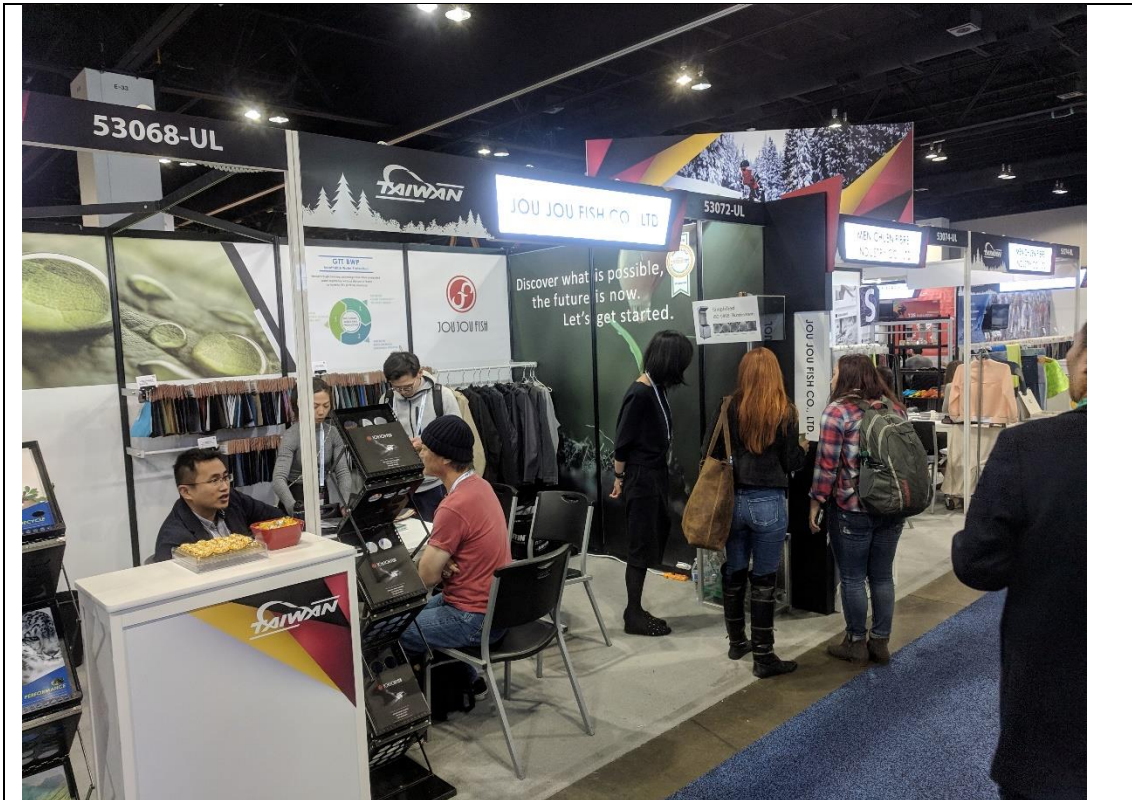
泓威公司展出情形