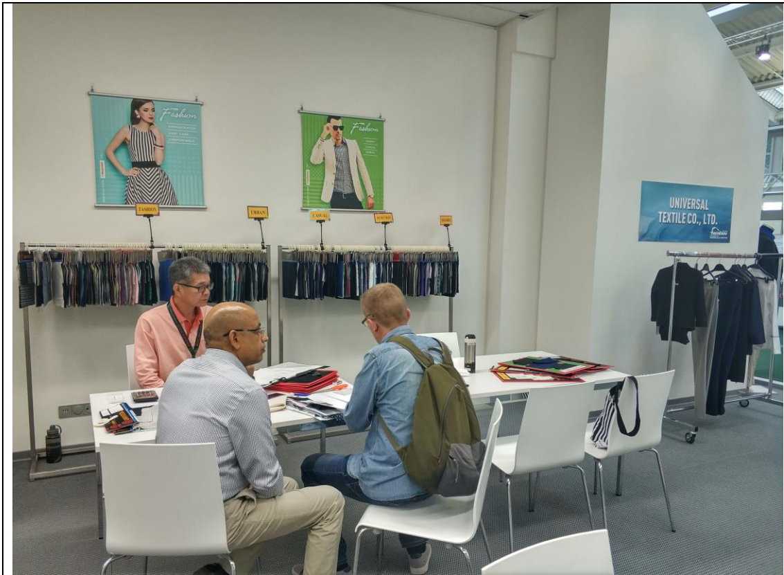
大宇紡織攤位洽談情形