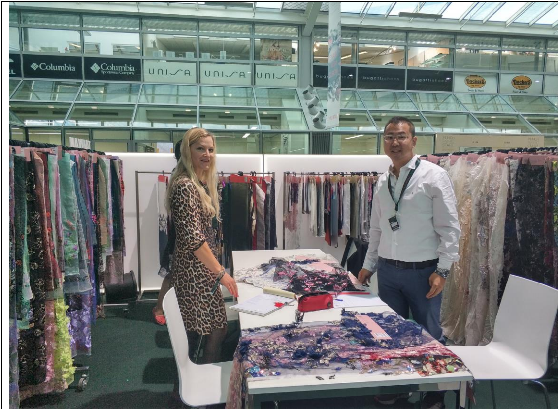
銘鎮公司展出情形