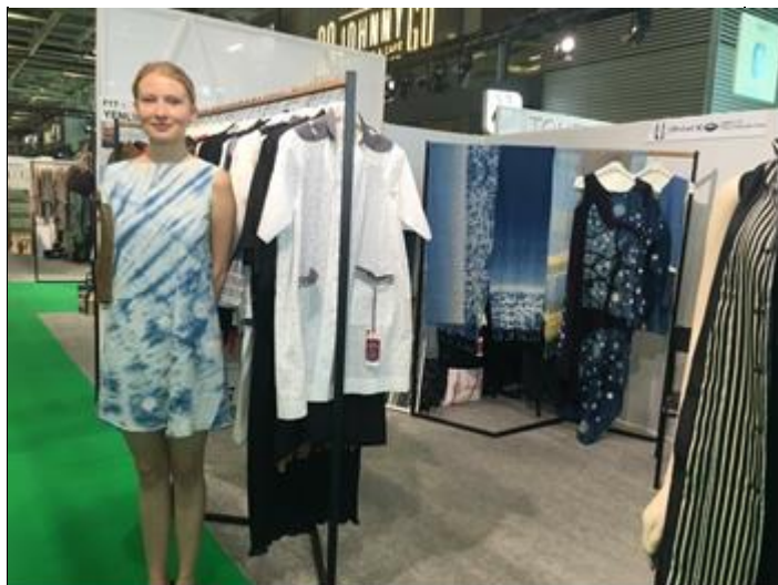
模特兒展示臺灣品牌 YENLINE 服飾