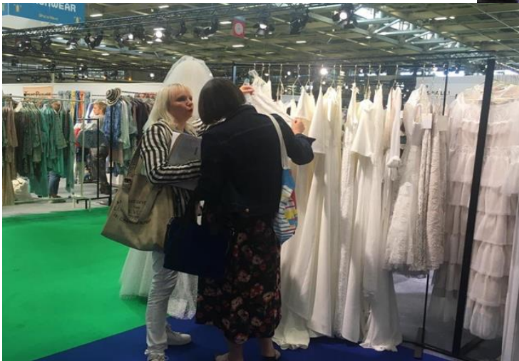
買主參觀 Caspia LiLi 展位