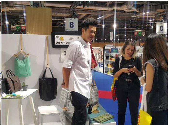
WEST VILLAGE 展位洽談