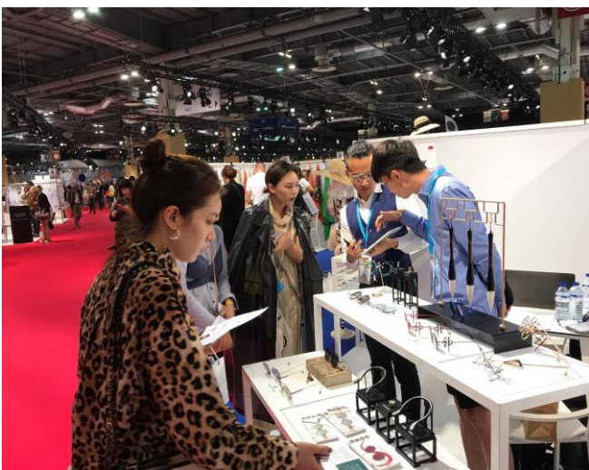
NAUGHTY SUNDAY 展位洽談