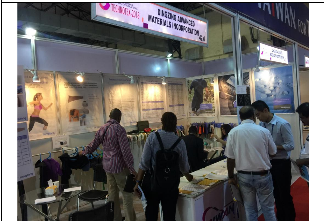
臺灣館廠商攤位洽談情形