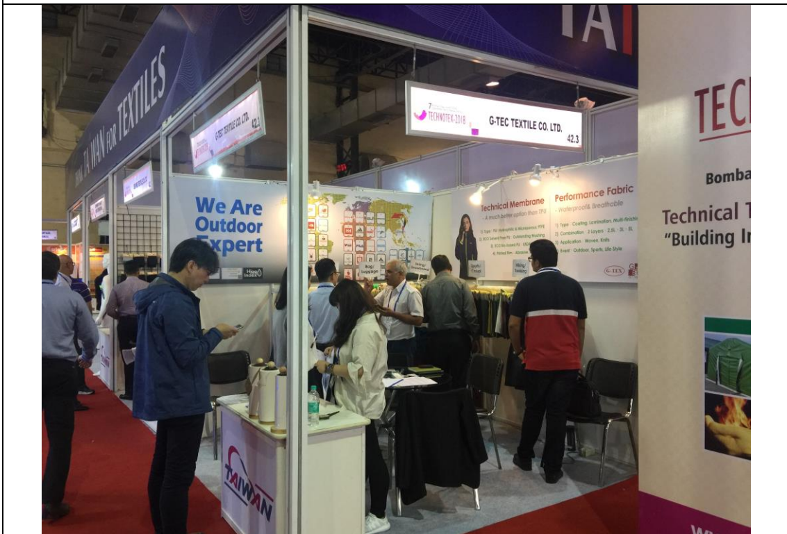
臺灣館廠商攤位洽談情形