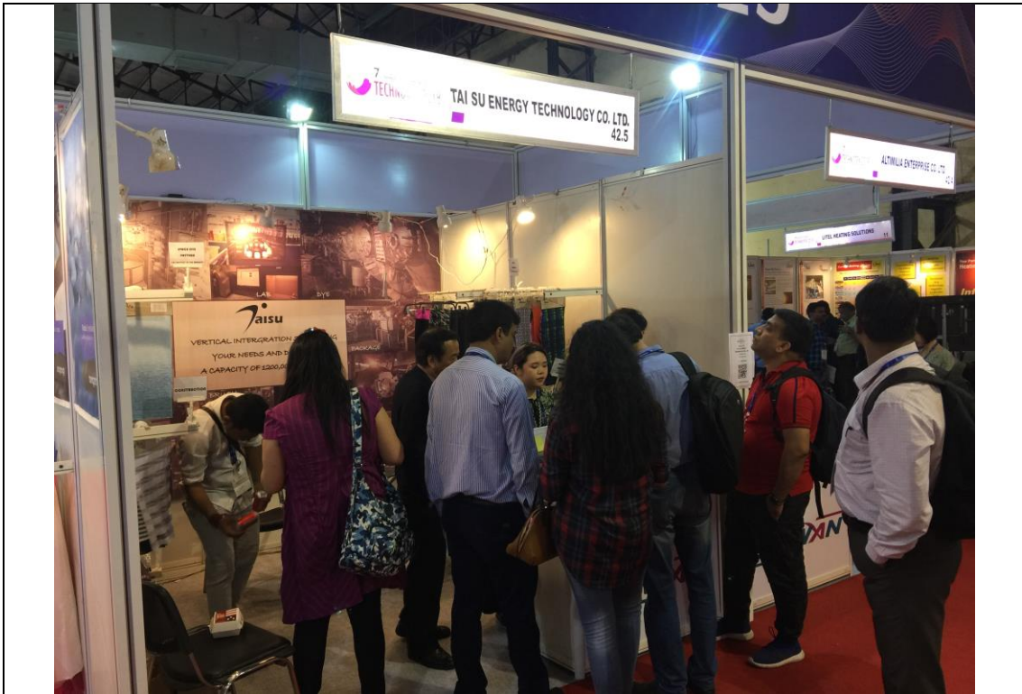
臺灣館廠商攤位洽談情形