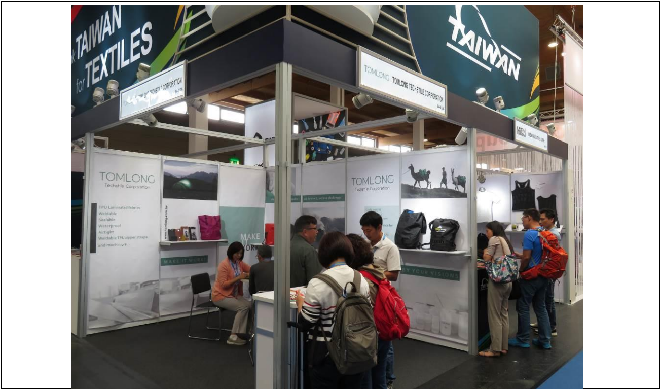
買主與湯姆隆公司人員商洽