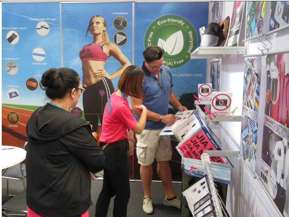
買主與佳美欣業人員商洽