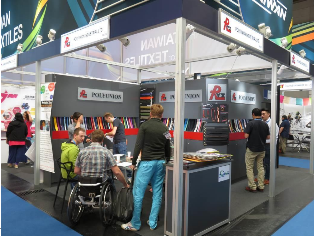
買主與信岳公司人員商洽