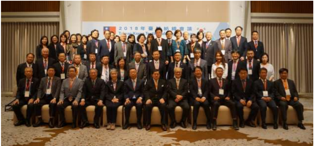
「2018 年臺韓紡織會議」與會代表合照