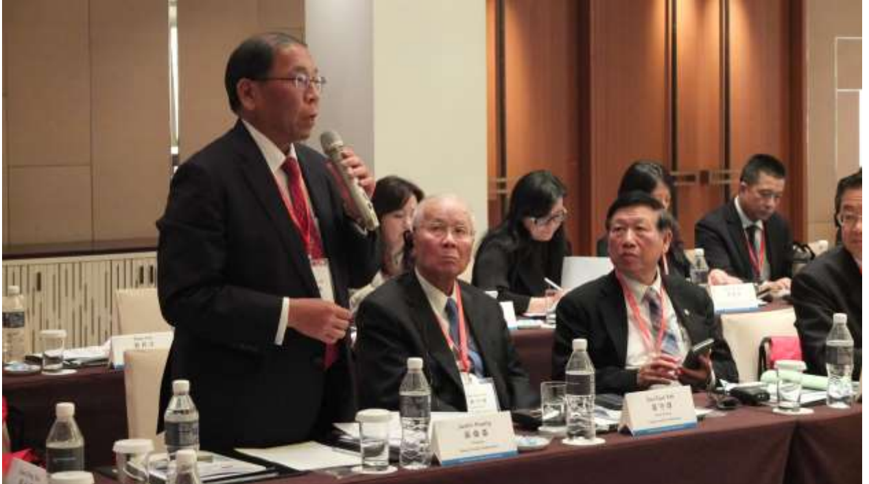
臺韓紡織會議代表討論與交流