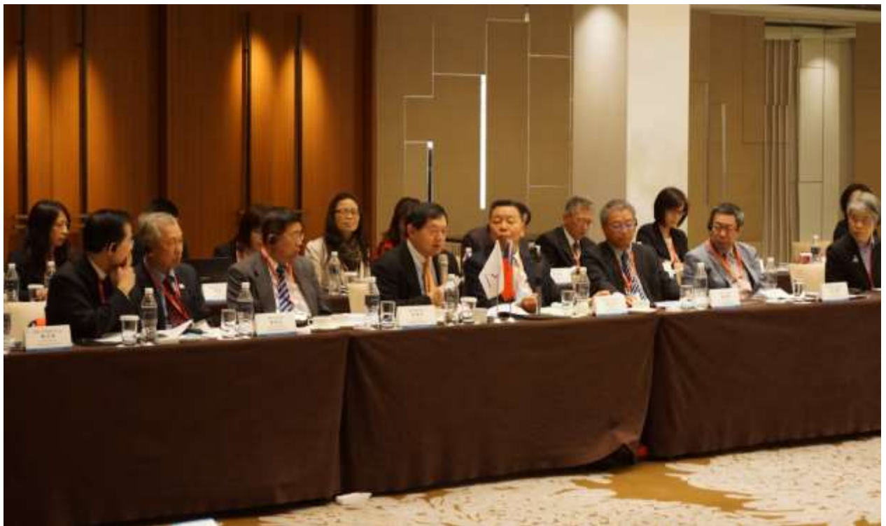
臺韓紡織會議代表討論與交流