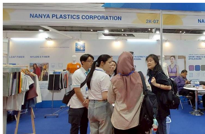
南亞公司與買主洽談