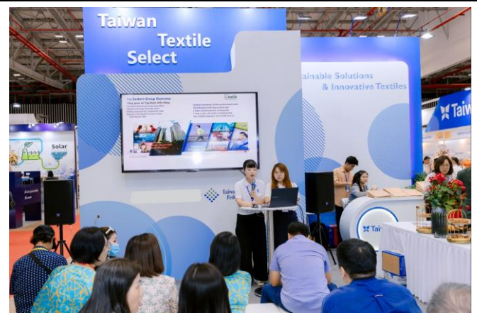
遠東新世紀代表於現場進行新產品發表