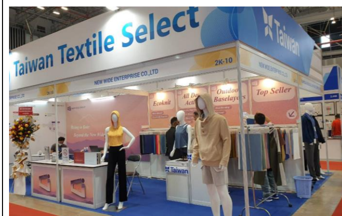
旭寬公司與買主洽談