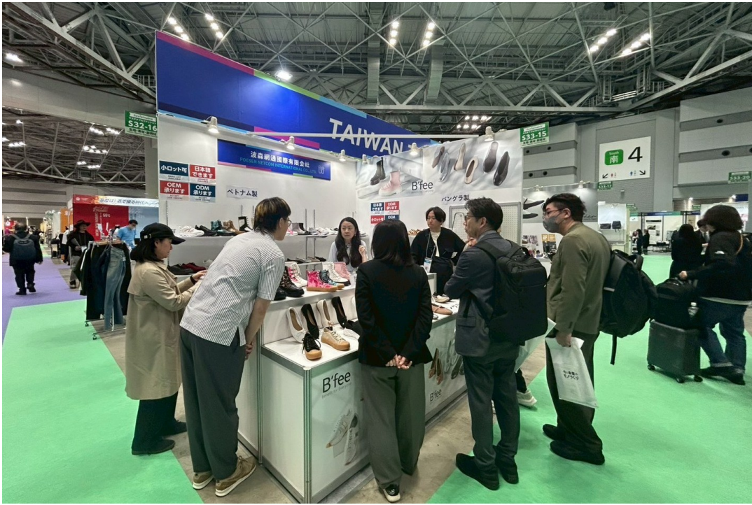
TAIWAN SELECT 展位