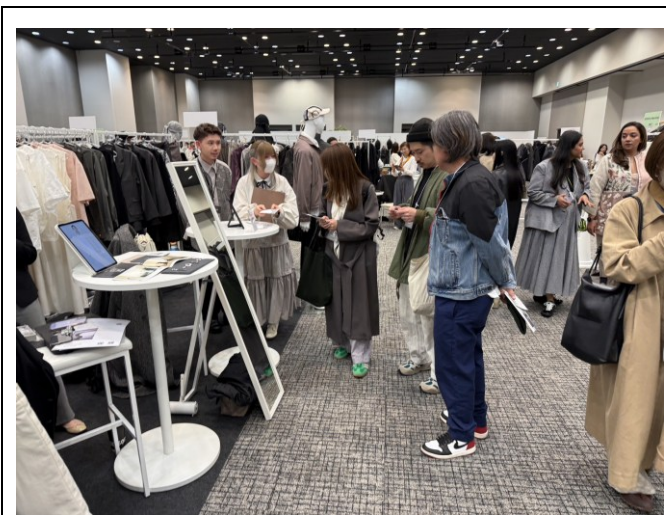
TRANOI TOKYO -odyssey 與買主商洽