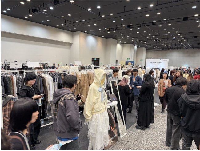
TRANOI TOKYO Taiwan Select 展位