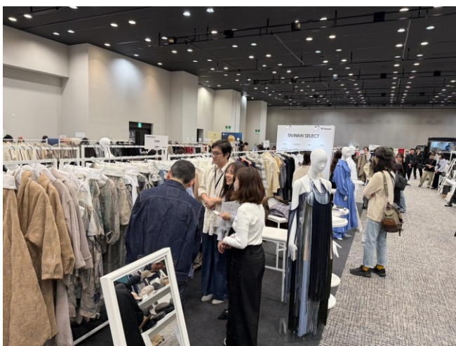
TRANOI TOKYO -CHIA 與買主商洽