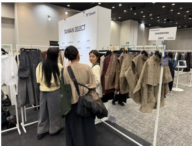
TRANOI TOKYO -CHARINYEH 與買主商洽