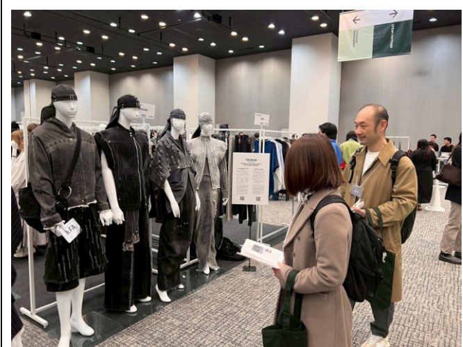
高雄時尚大賞金獎作品