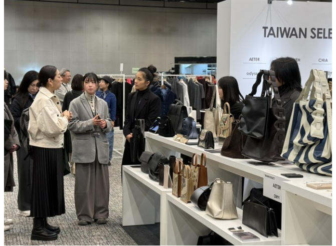
TRANOI TOKYO -AETER 與買主商洽