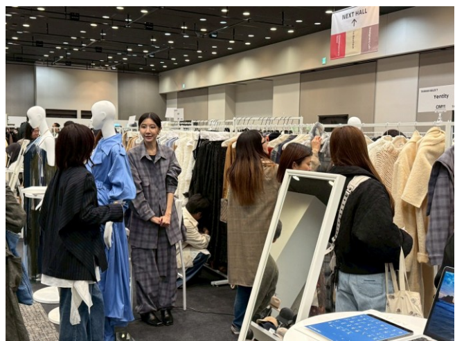
TRANOI TOKYO -Yentity 與買主商洽