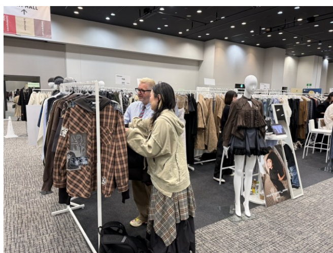
TRANOI TOKYO -PCES 與買主商洽