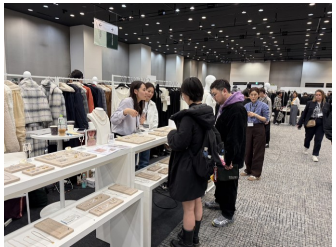
TRANOI TOKYO -LESIS 與買主商洽