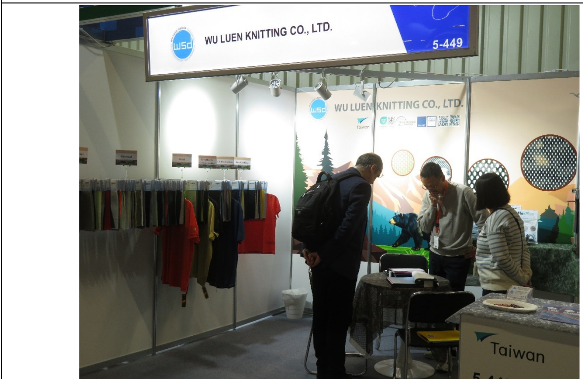
五綸公司與買主商洽