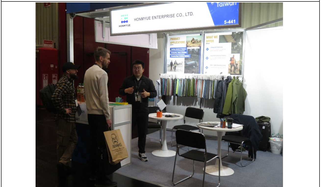
弘裕公司與買主商洽