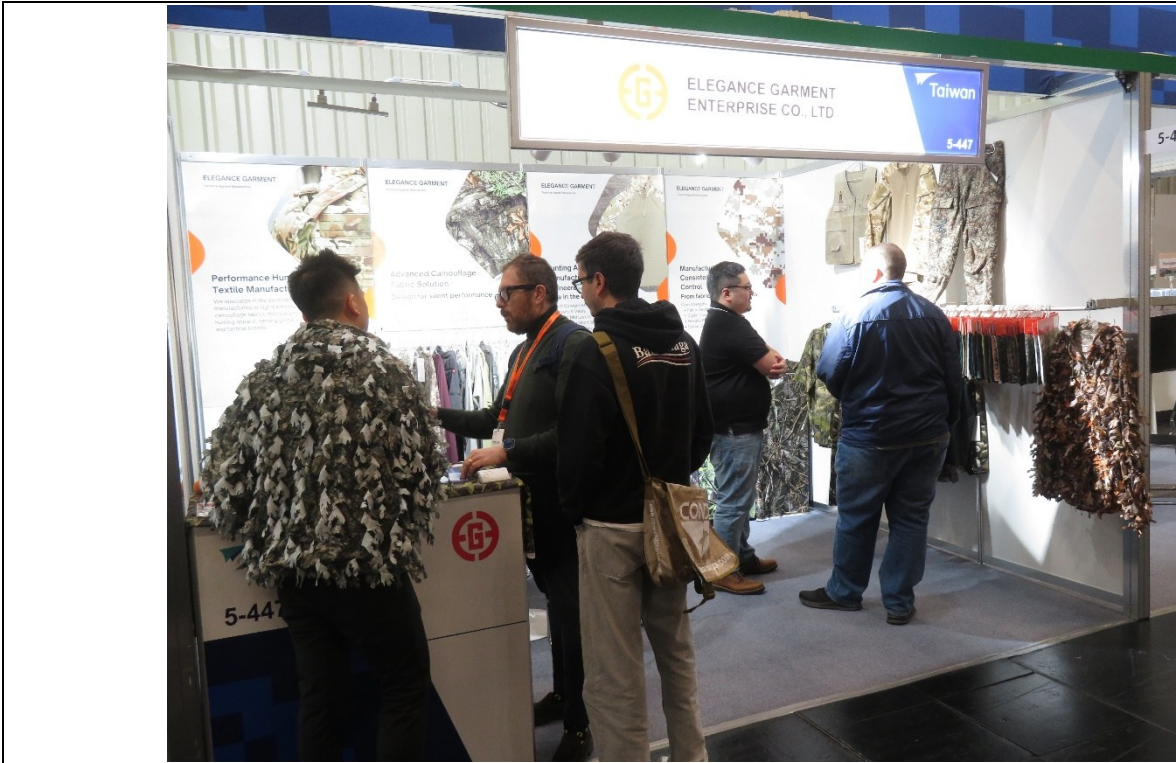
郁祥公司與買主商洽