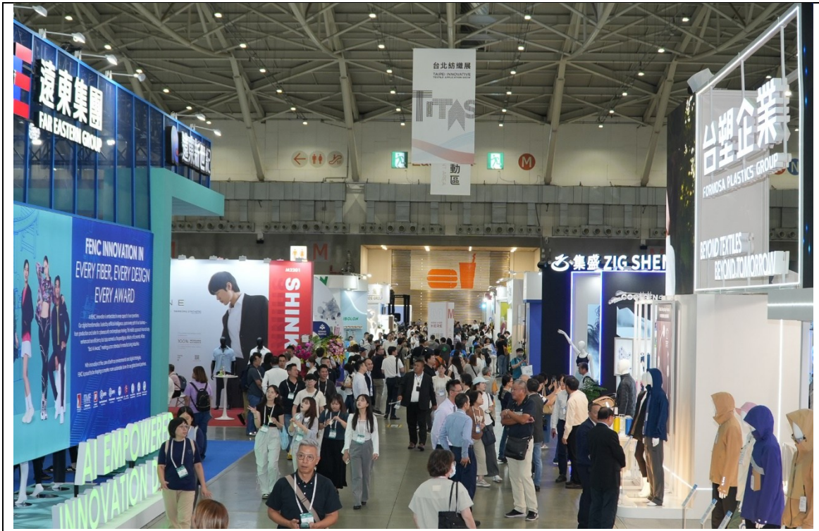
2025台北紡織展展出實況