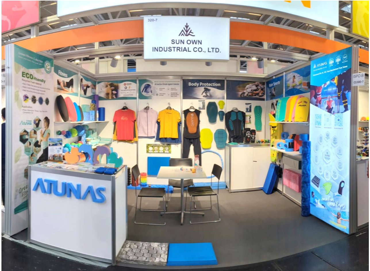
2024 ISPO Munich 德國慕尼黑運動用品展 歐都納公司展位