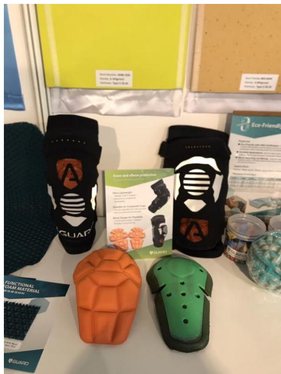
紡拓會與歐都納結合山王工業發泡材料，共同合作開發之防摔衣、護膝、護肘等護具