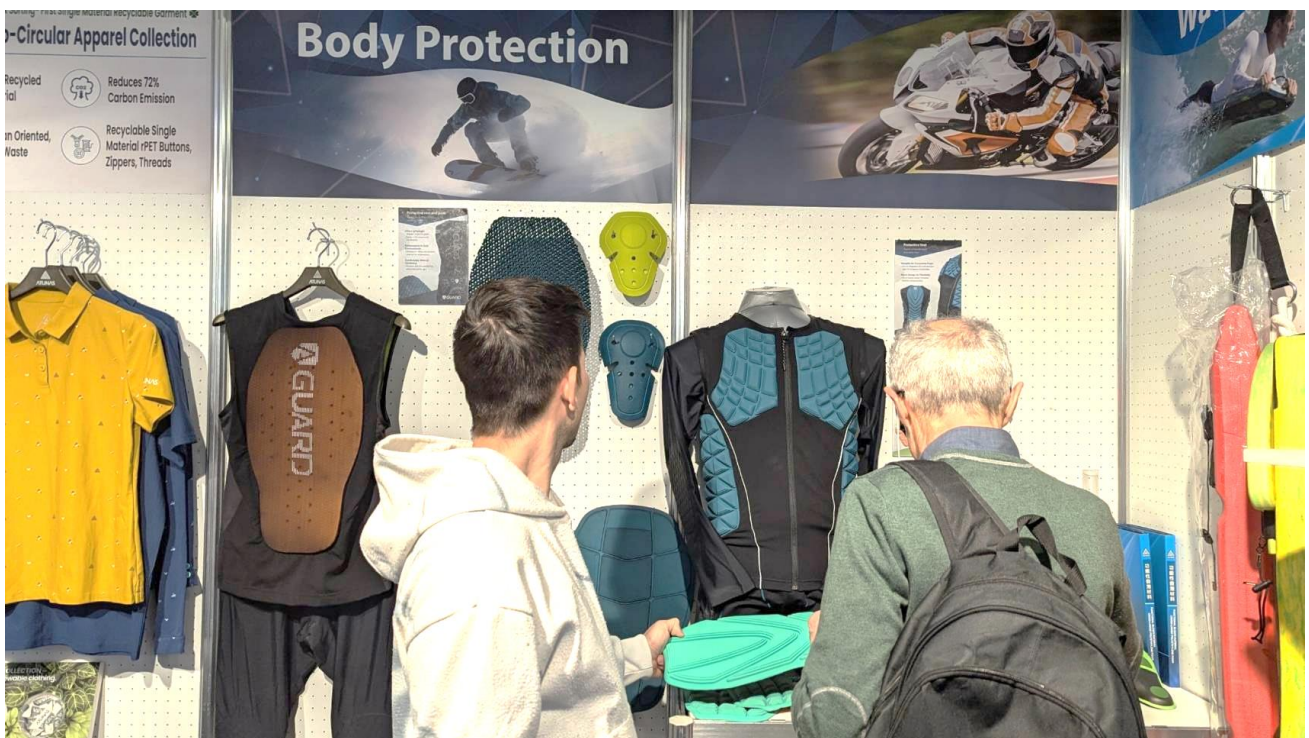
紡拓會與歐都納結合山王工業發泡防護材料，共同合作開發高強防護防摔服飾是展位亮點