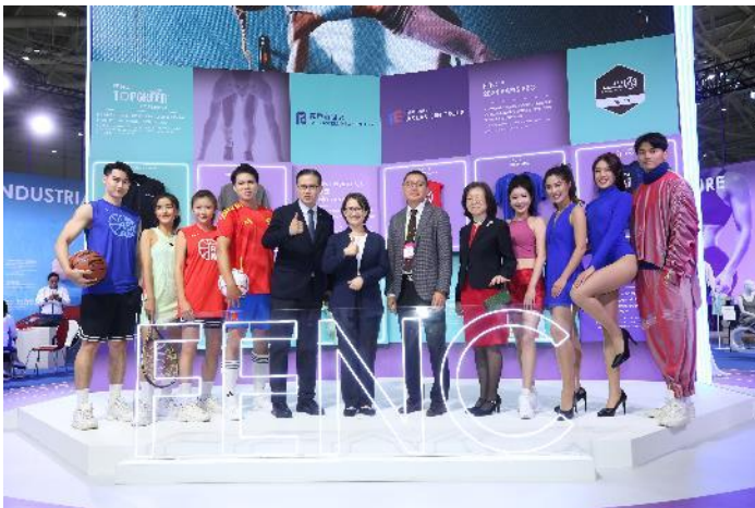
蕭副總統參觀遠東新世紀