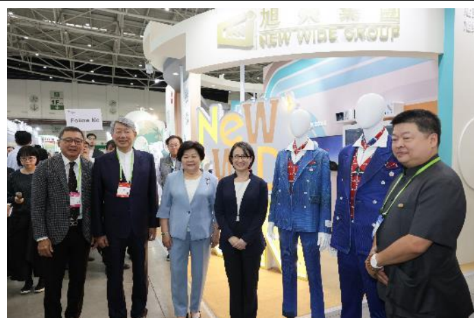
蕭副總統參觀旭榮集團