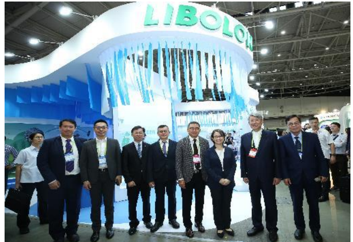
蕭副總統參觀力麗集團