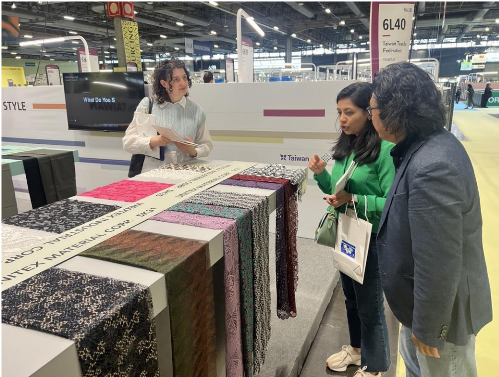
買主蒞臨專區並與業者現場交流