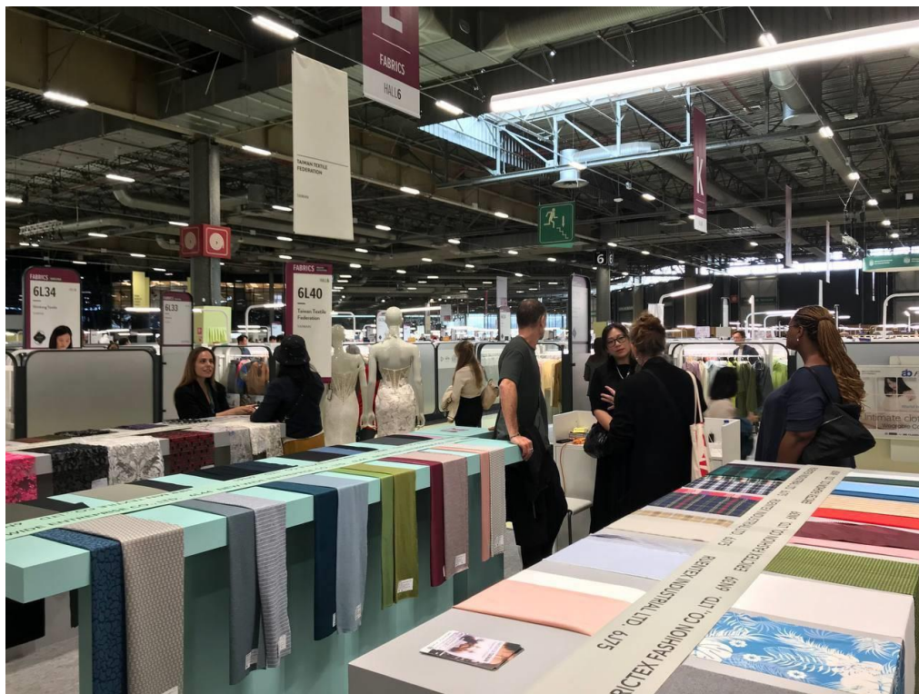
買主蒞臨專區並與紡拓會代表現場交流