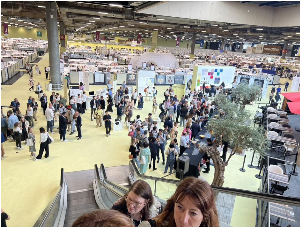
Première Vision 展人潮踴躍