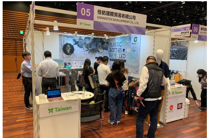
農業廢棄物回收等永續環保紡織品 受到日本買主矚目