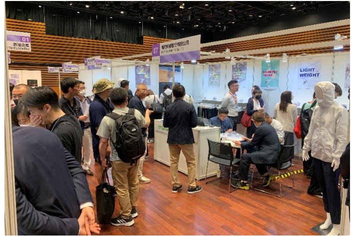
買主到場參觀踴躍