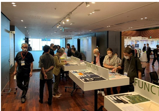
主題形象區精選業者機能性及永續環保主題 的展品吸引買主駐足瀏覽