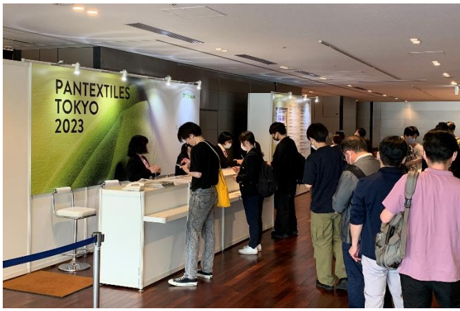
臺灣紡織品東京展示會會場