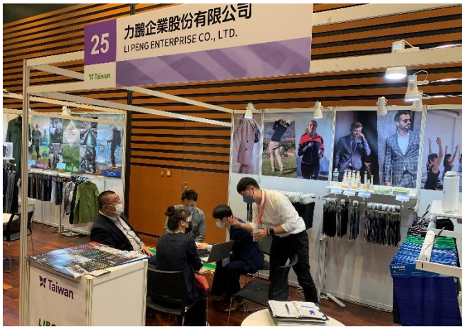
參展業者與買主熱絡商洽