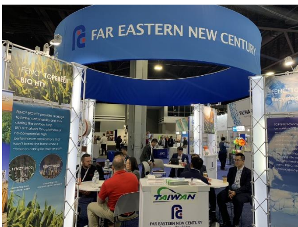
買主與臺灣館廠商洽談情形