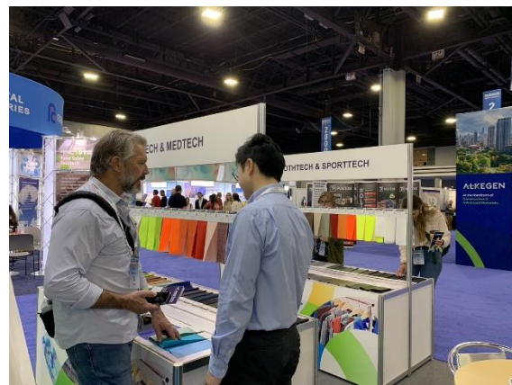
臺灣廠商精選紡織品聯合推廣專區 吸引買主蒐尋