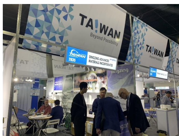
買主與臺灣館廠商洽談情形