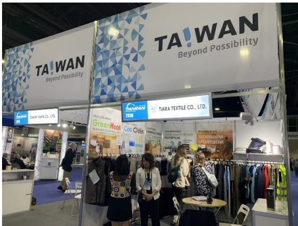
買主與臺灣館廠商洽談情形