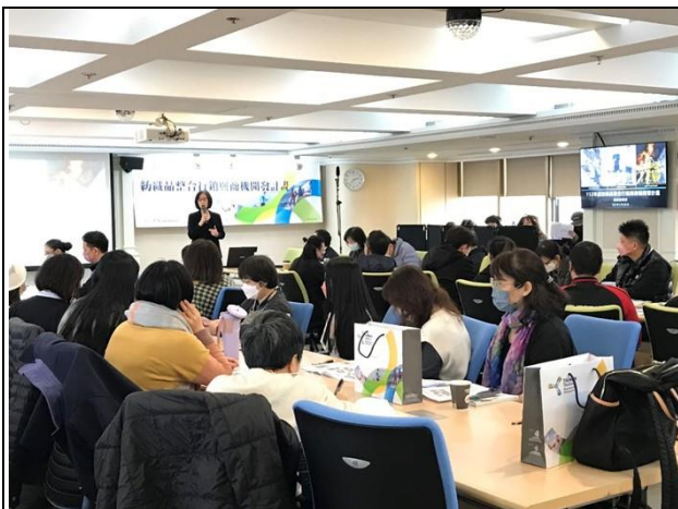
2/20 計畫推廣說明會參與人數眾多