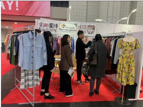
買主與臺灣館廠商洽談情形 - 南緯公司