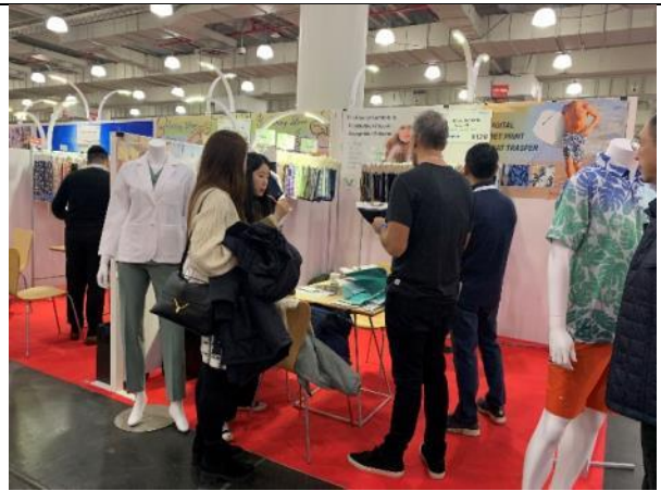
買主與臺灣館廠商洽談情形 - 富豐公司