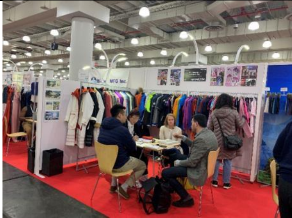
買主與臺灣館廠商洽談情形 - 勝利蕾絲