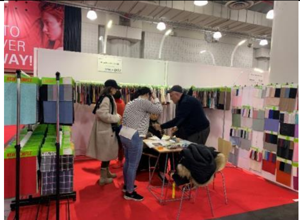
買主與臺灣館廠商洽談情形 - 帛諦公司