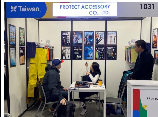
買主與臺灣館廠商洽談情形