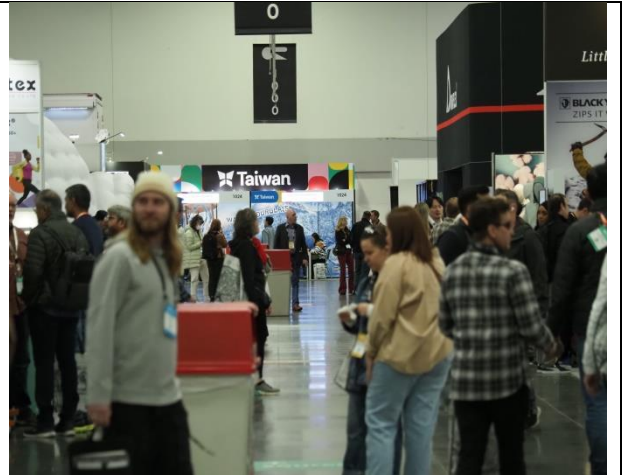
位於主走道的臺灣館人潮