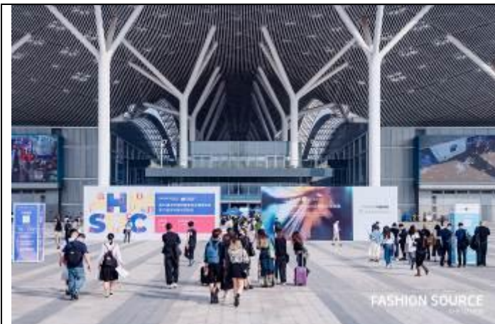
第 25 屆深圳國際服裝供應鏈博覽會暨 第 10 屆深圳原創設計時裝周