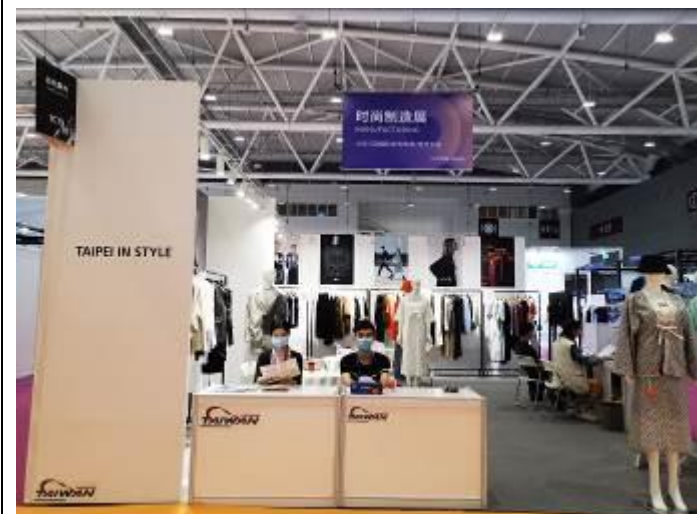
Taipei IN Style 攤位