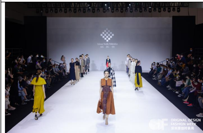
台北魅力時尚匯演 大謝幕