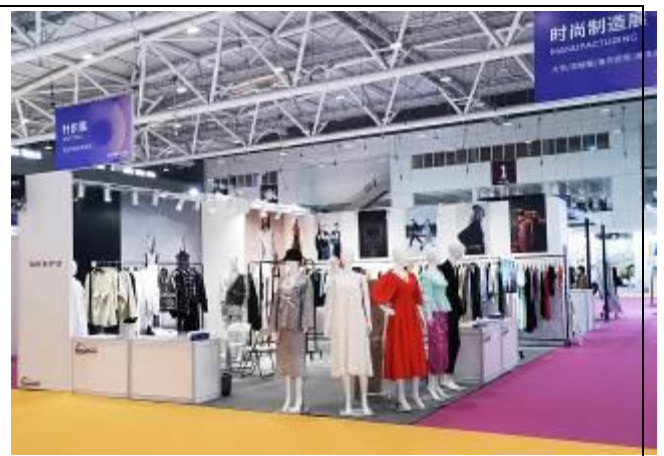
Taipei IN Style 攤位