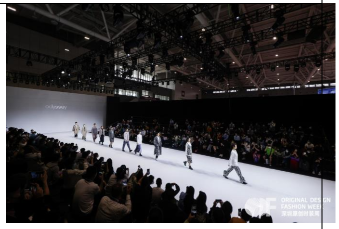
台北魅力時尚匯演 人潮滿座