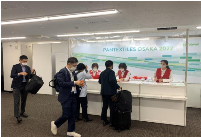
臺灣紡織品大阪展示會會場