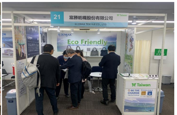
環保紡織品受到日本買主矚目