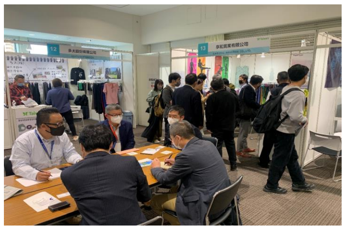
參展業者與買主熱絡商洽