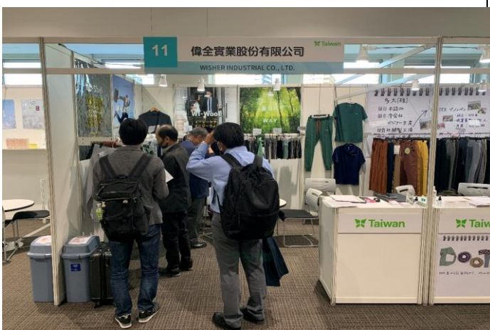
買主到場參觀及挑選產品