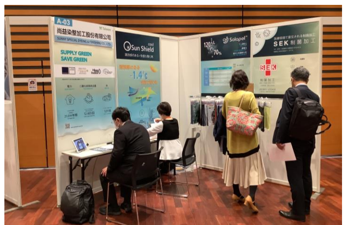
買主透過視訊與參展商進行商洽