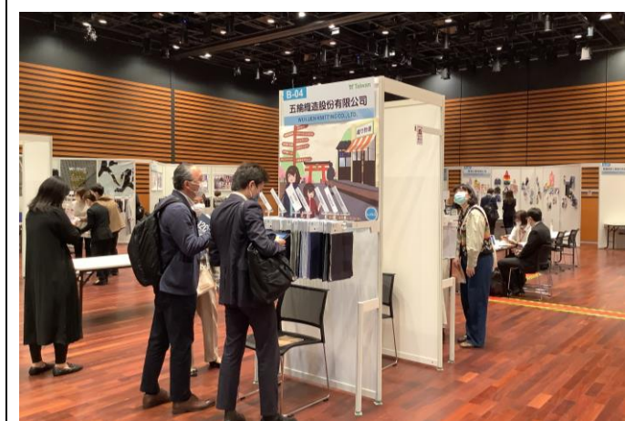
買主到場參觀踴躍