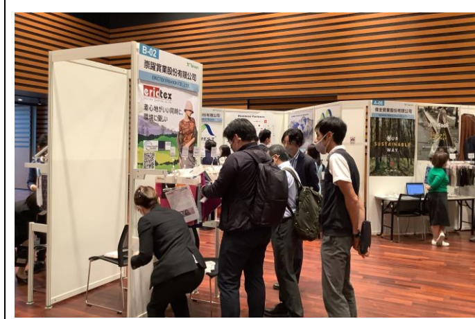
買主到場參觀及挑選產品