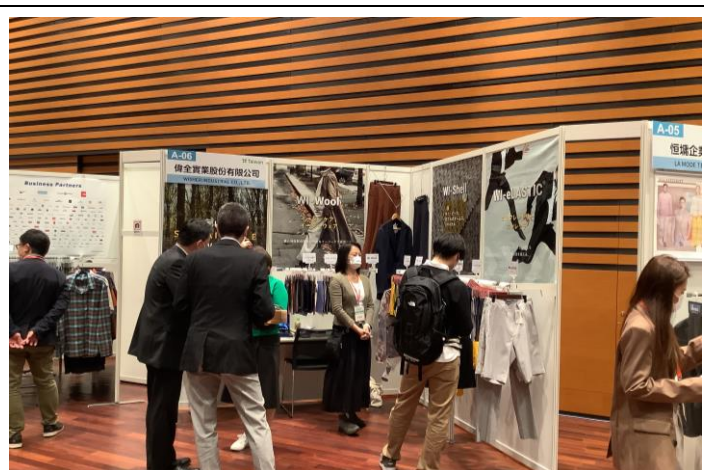
參展業者派員赴日本接待買主