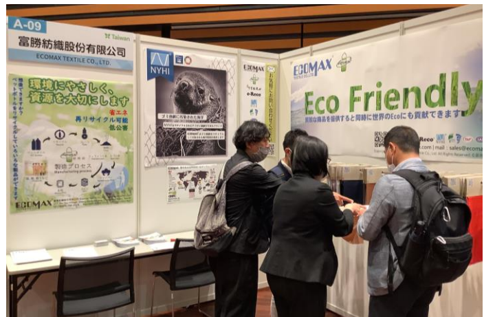
環保紡織品受到日本買主矚目