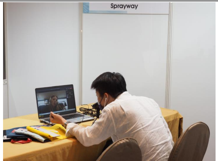
業者與英國品牌視訊洽談