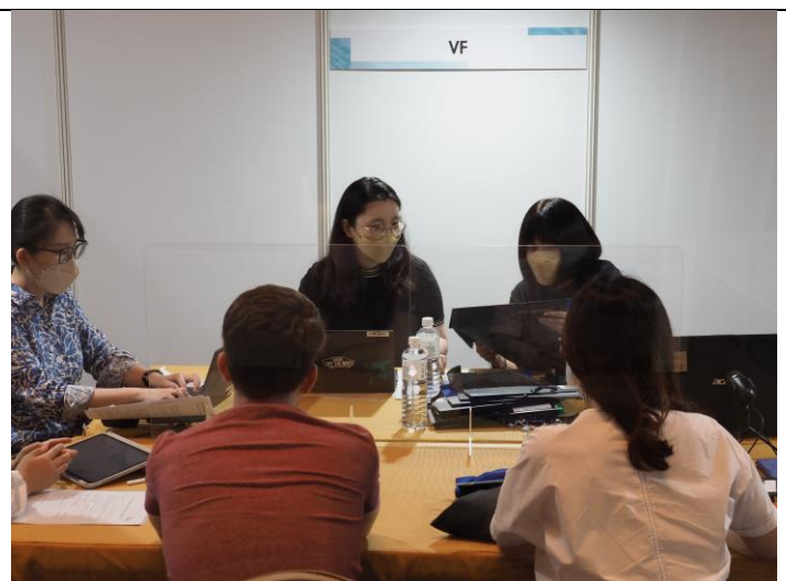
業者與美國品牌在臺分公司實體洽談