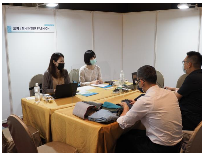
業者與日本商社在臺分公司實體洽談