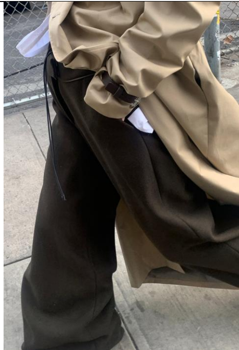
印尼品牌 Glenda Garcia 設計師： Glenda Garcia