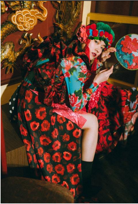
日本品牌 DOKKA vivid 設計師： Nodoka Sugauchi / Akiho Ka