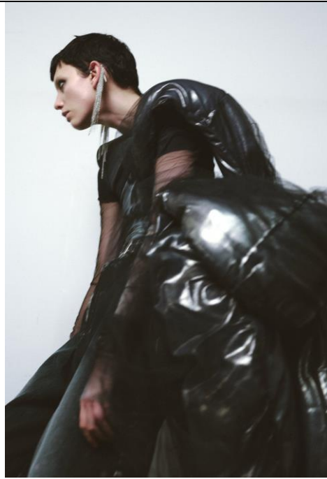
日本品牌 YUUNA ICHIKAWA 設計師： Yuuna Ichikawa