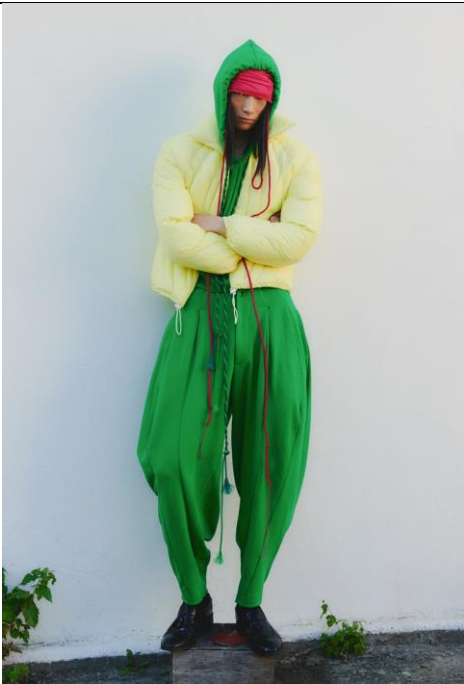
韓國品牌：SUNG JU 設計師： Sung ju Lee