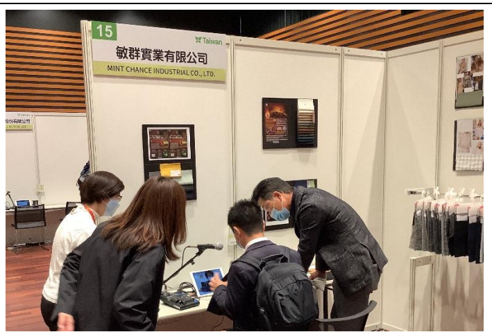
參展商透過視訊向買主報價