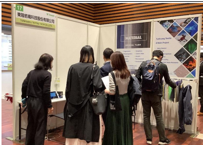
買主參觀展示會場，挑選產品