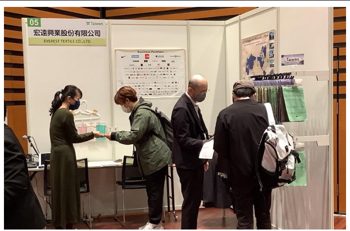
參展商在日本的代理接待買主