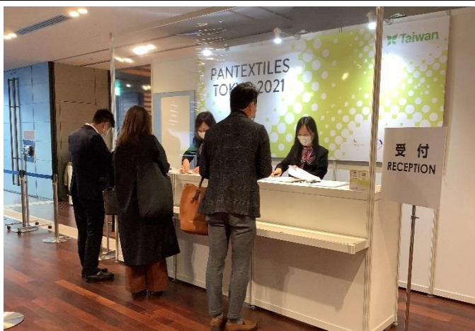
臺灣紡織品東京展示會會場