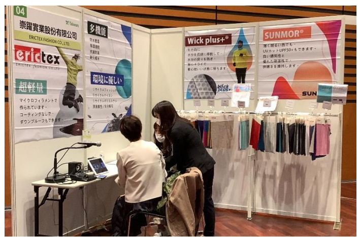
買主透過視訊與參展商進行商洽