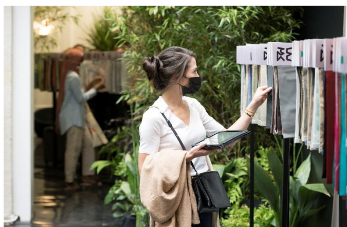
買主參觀展示會場，以行動裝置留下採購資訊