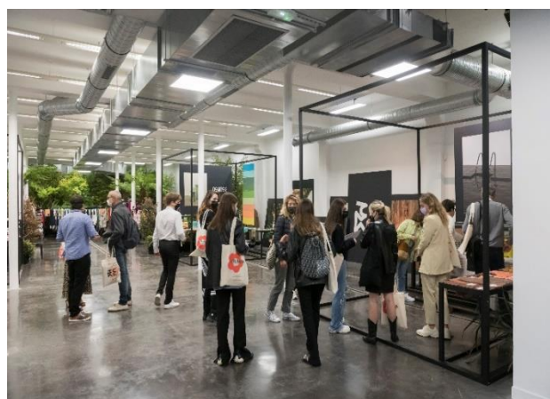
買主到場參觀踴躍