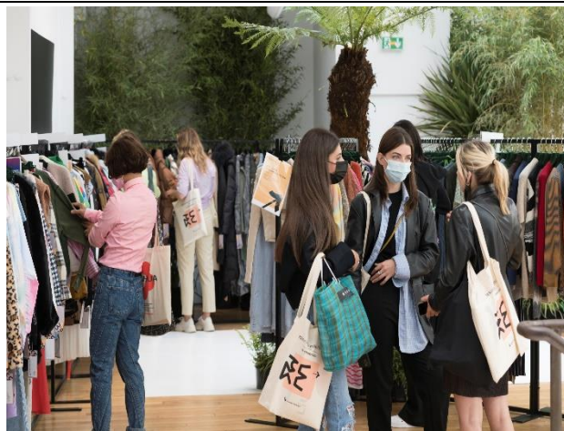
買主參觀展示會場，挑選產品