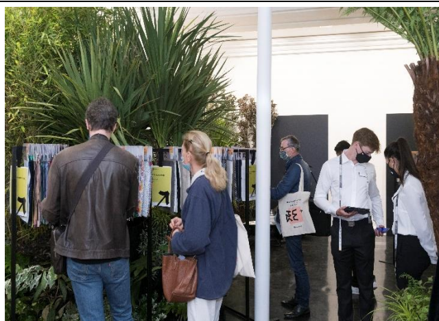
買主參觀展示會場，挑選產品