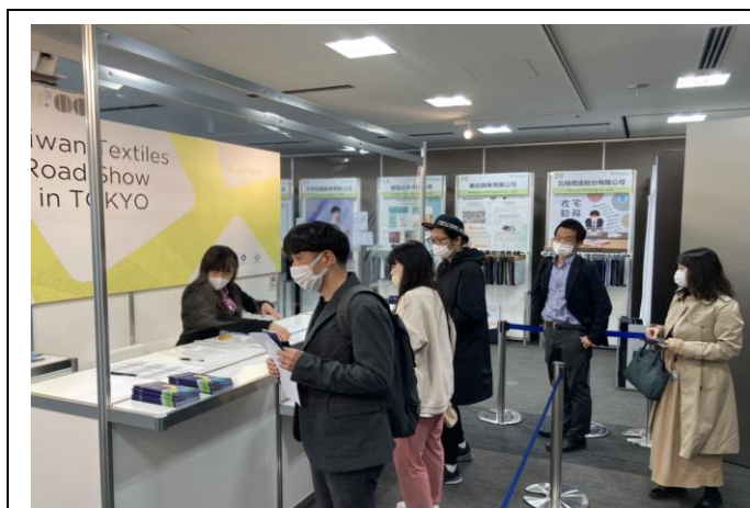
臺灣紡織品東京展示會會場