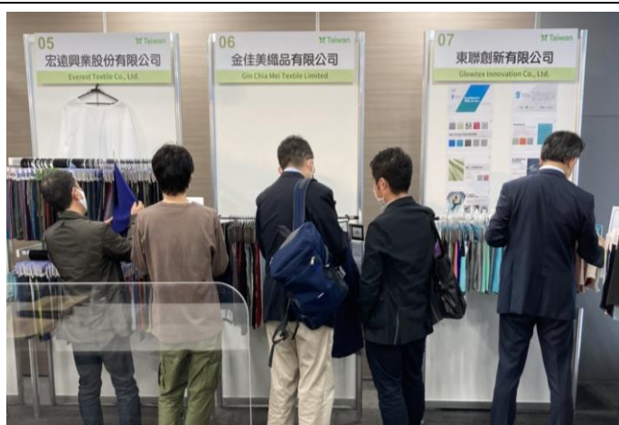
買主參觀展示會場，挑選產品