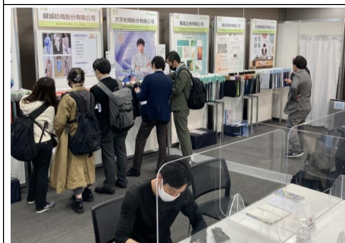
買主到場參觀踴躍