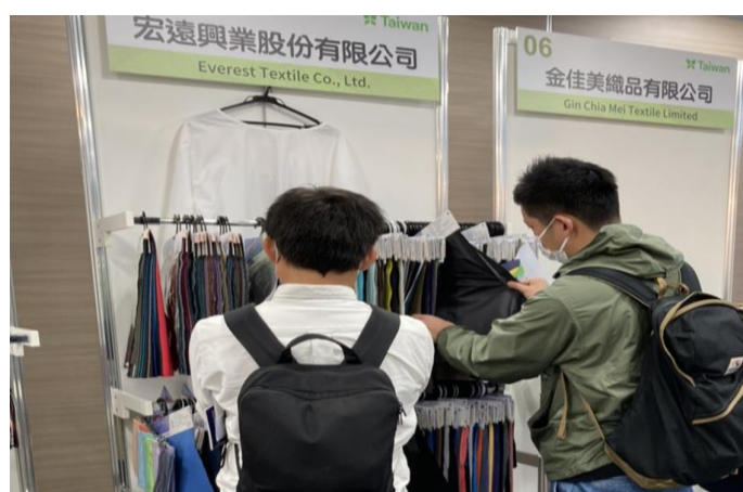
買主參觀展示會場，挑選產品