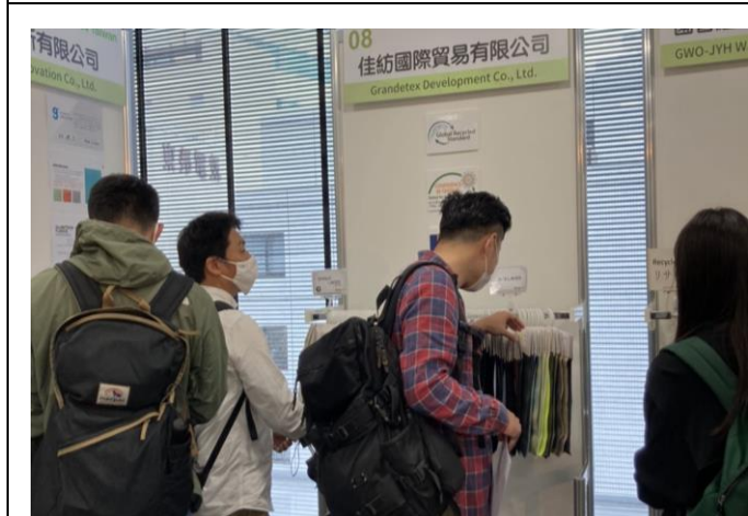
買主參觀展示會場，挑選產品