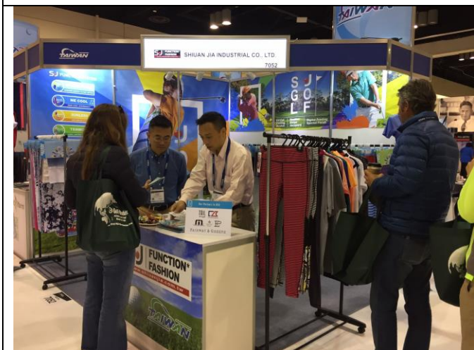
軒嘉公司與買主洽談情形