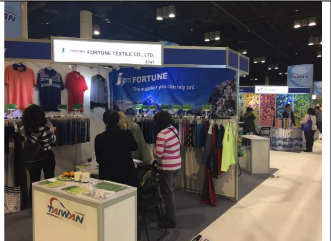
福鈺公司與買主洽談情形