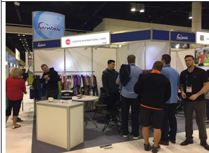
旭冠創新科技公司與買主洽談情形