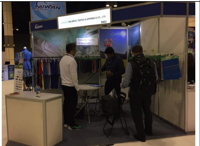
彩昱公司與買主洽談情形