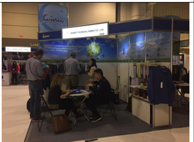
郁義公司與買主洽談情形